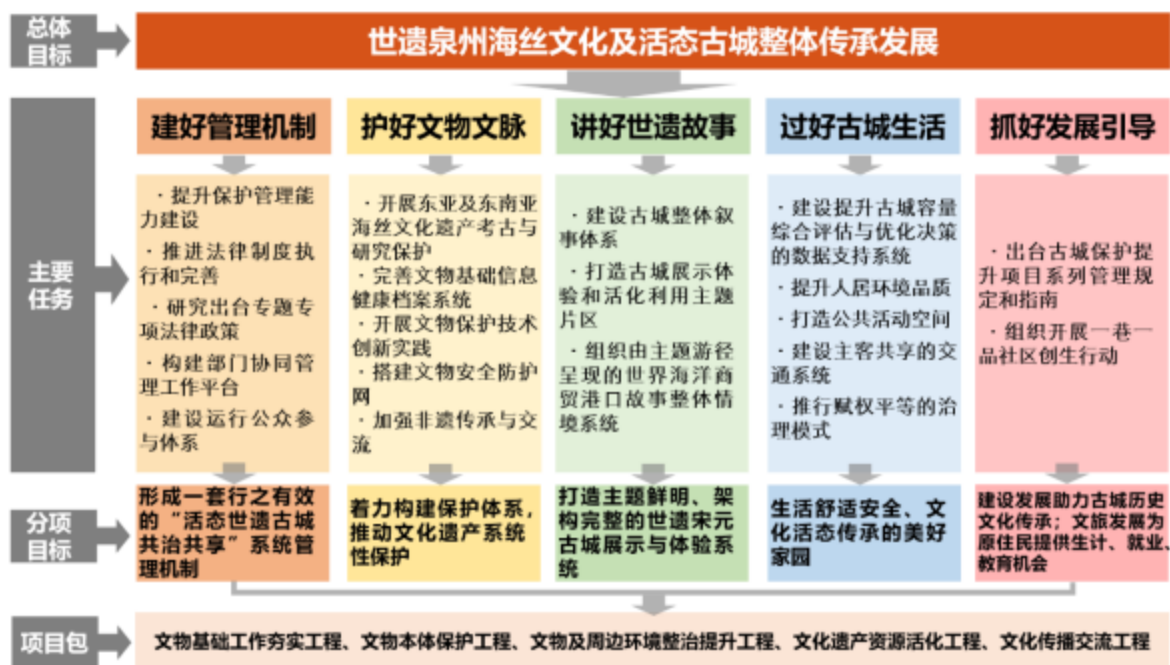
图 1 创建思路结构图